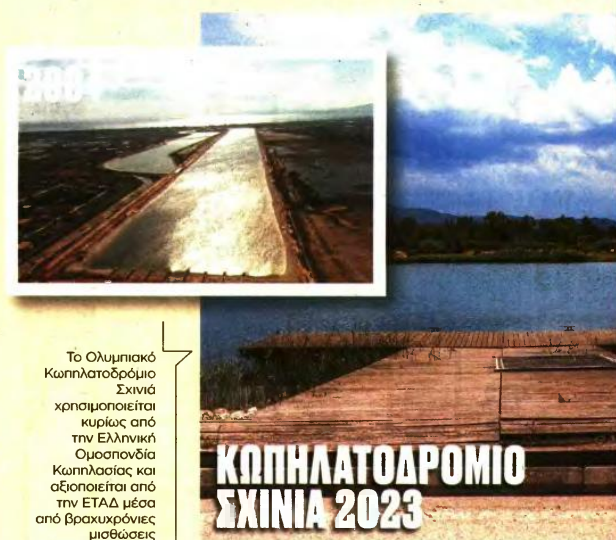
Το Ολυμπιακό Κωπηλατοδρόμιο Σχινιά χρησιμοποιείται κυρίως από την Ελληνική Ομοσπονδία Κωπηλασίας και αξιοποιείται από την ΕΤΑΔ μέσα από βραχυχρόνιες μισθώσεις

Ερευνας και Τεχνολογίας και σύμβαση με την Ομοσπονδία Μοντέρνου Πεντάθλου.